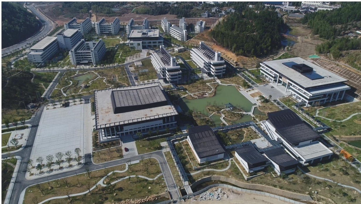
图为已竣工的龙岩市委党校搬迁扩建工程